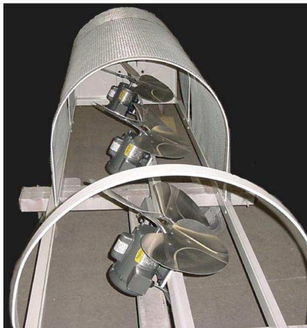
Колебательные вентиляторы с вертикальным обдувом